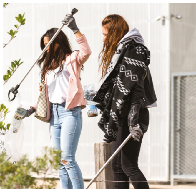
Événement « Clean Walk Artem » organisé dans le cadre du Campus Durable et Responsable (CADRE) et des 20 ans de l'Alliance Artem.

ICN Business School a pour mission d'être une école à impact positif sur les êtres vivants et l'environnement dans le but de former des managers responsables !