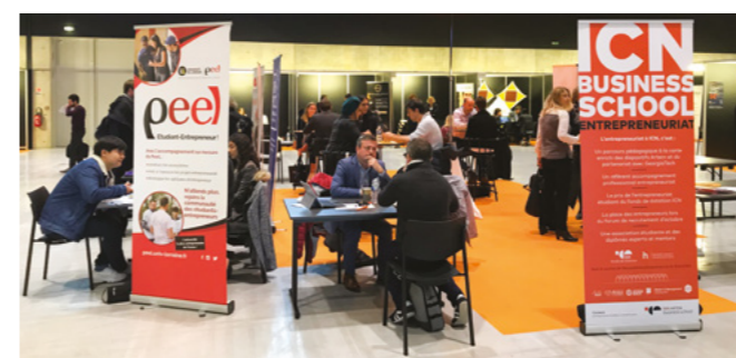
Forum « Place des entrepreneurs » - Octobre 2019

Plus d'infos sur icn-artem.com/ecole-entrepreneurs