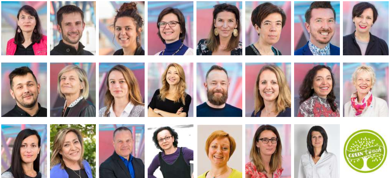
Les 24 membres du comité de pilotage RSE/ISO 26000

Merci au fonds de dotation ICN et à ses membres qui ont souhaité soutenir financièrement l'évaluation « Engagé RSE » et qui a récompensé cette initiative dans le cadre du prix de l'innovation 2018/2019.